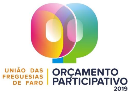
IMAGEM DE COMUNICAÇÃO OP 2019